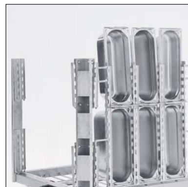
Supporto per contenitori GN 1/3, GN 1/6 e GN 1/9 (parte n. 3-736).