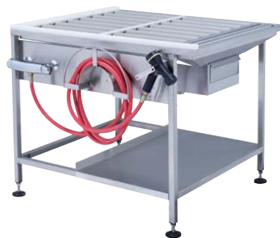
Tavolo di caricamento (parte n. 3-7370) con unità di risciacquo (parte n. 3-7390).