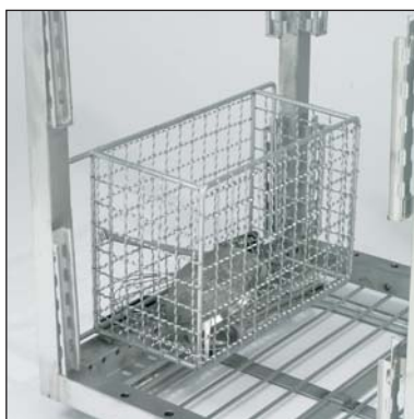
Cestino per piccoli utensili (parte n. 3-7357).