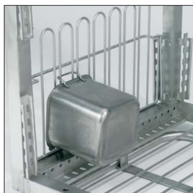
Supporto per contenitori ABC (parte n. 3-7356).