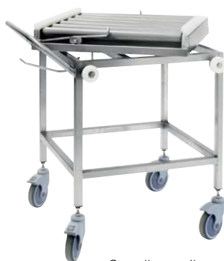
Carrello per il trasporto dei cestelli (parte n. 3-7362).

L'azienda si riserva il diritto di modificare i dati tecnici.