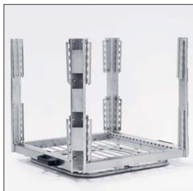
Cestello di lavaggio (parte n. 3-7340). In dotazione.