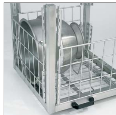
Griglia laterale (parte n. 3-7354). In dotazione.