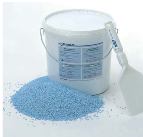
Lavaggio rapido ed efficace con granuli di plastica senza ammollo. Granuli di plastica (parte n. 3-7260). Raschietto (parte n. 3-7261).

Il lavaggio con i granuli riduce la necessità delle normali operazioni preliminari quali l'ammollo o lo scrostamento. Gli oggetti vengono lavati con una miscela di acqua, detersivo e granuli di plastica. I residui bruciati vengono rimossi rapidamente ed efficacemente senza ammollo. Prima del lavaggio, occorre rimuovere soltanto i resti di cibo non incrostati. Una serie di opzioni di programma uniche, tra cui la centrifuga, consentono di asciugare gli oggetti rapidamente garantendo la massima igiene.