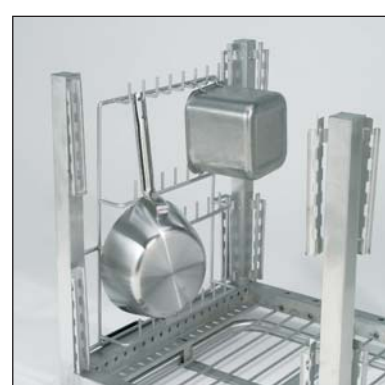
Supporto per contenitori con manico (parte n. 3-7350).