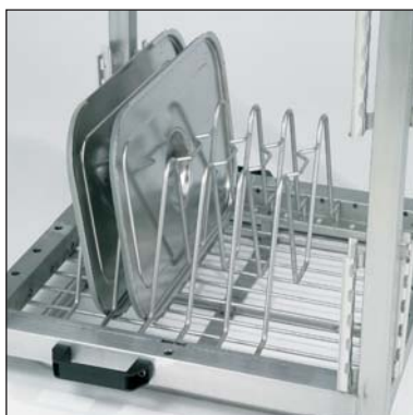
Supporto per coperchi (parte n. 3-7341). In dotazione.