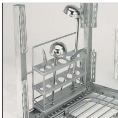
Portautensili (parte n. 3-7353). Per utensili alti al massimo 650 mm.