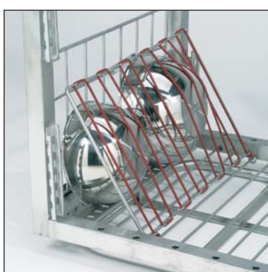
Insero con elastici (parte n. 3-7351). Da utilizzare con la griglia laterale.